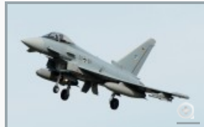
...einer NATO-Alarm-Rotte in voller Bewaffnung...