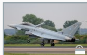
Bremsspoiler bei der Landung