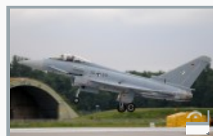
Wenige Meter zum *Touch-Down*