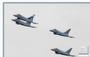
Alarm-Rotte im NATO-Auftrag