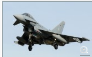
Alltag am Fliegerhorst Neuburg: Rückkehr...