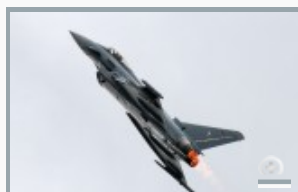
Himmelsstürmer mit Nachbrenner

60 Jahre Bundeswehr, 55 Jahre Luftwaffen-Standort Neuburg und zehn Jahre Stationierung des *Eurofighter* am Fliegerhorst. Diese drei Jubiläen sollen am *Tag der Bundeswehr* entsprechend groß gefeiert werden. Geplant sind Flugvorführungen der aktuell bei der Luftwaffe, Marine und Heer eingesetzten Flugzeugmuster. Im *Static-Display* werden Jets aus früheren Zeiten zu sehen sein.