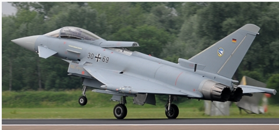
Landung Eurofighter am Fliegerhorst Neuburg a.d.Donau

Neuburg-München (D) [ENA] Der Termin steht bereits fest und ist mit 11. Juni 2016 im Kalender markiert. An diesem Tage findet zum zweiten Male der *Tag der Bundeswehr* bundesweit statt. Umfangreiche Vorbereitungen stehen für den Fliegerhorst in Neuburg an der Donau nun an. Man rechnet mit 100.000 Besuchern.