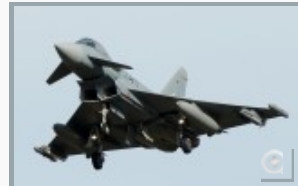
...nach Fehlalarm im süddeutschen Luftraum.

Somit sind die Blicke der Öffentlichkeit aber auch von internen Führungsriegen auf den neuen Kommodore gerichtet. Dabei wird ein gutes Gelingen des *Tag der Bundeswehr* am 11. Juni als Groß-Event natürlich von Bedeutung sein. Einen positiven Rückhalt in den anliegenden Gemeinden hat der Standort Neuburg an der Donau ohnehin. Die 1.000 Bundeswehrangehörigen stellen doch einen nicht zu unterschätzenden Wirtschaftsfaktor im Umfeld dar.