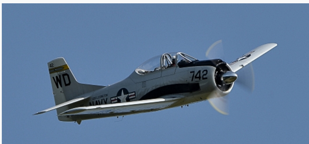
T-28 Trojan - Flugplatzfest Degerfeld 2017

München (D) [ENA] Oftmals wird die T-28 Trojan als *Warbird* bezeichnet. Doch dies ist falsch. Als Trainingsflugzeug für die *US Air Force* wurde sie anfangs der 1950er Jahre in Dienst gestellt. Noch heute ist dieser Flugzeugtyp bei Piloten sehr beliebt und ist ein gerngesehener Gast auf Flugshows.