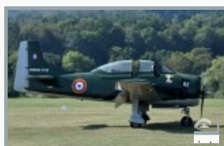
Hahnweide (2016) - *Fennec* ist der Name der französischen Variante